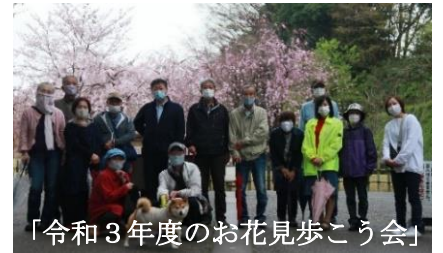
「令和3年度のお花見歩こう会」