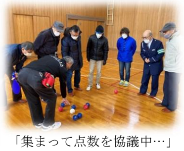
「集まって点数を協議中…」